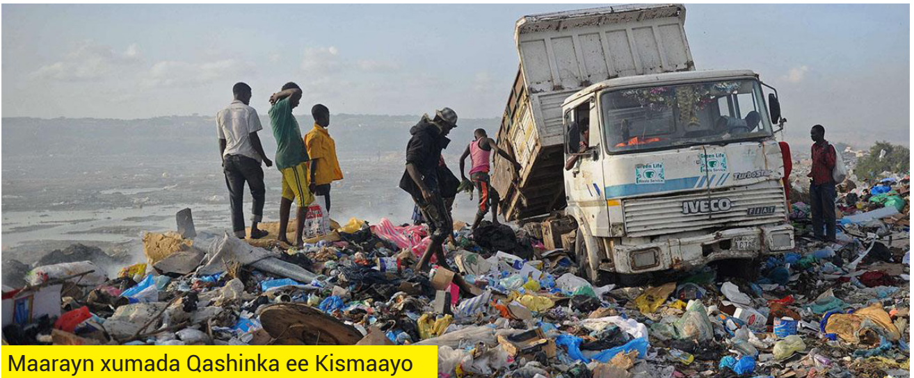
Maarayn xumada Qashinka ee Kismaayo

Kordhinta Dhaqashada Xoolaha: Lo'da iyo ariga waxa ay soo saaraan xaddi badan oo ah gaaska loo yaqaan Methane marka ay dheefshiidaan cuntada oo saaloodaan.