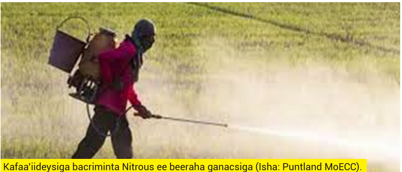
Kafaa'iideysiga bacriminta Nitrous ee beeraha ganacsiga.

Bacriminta ay ku jirto nitrogen, waxa ay soo saartaa Nitrous Oxide.