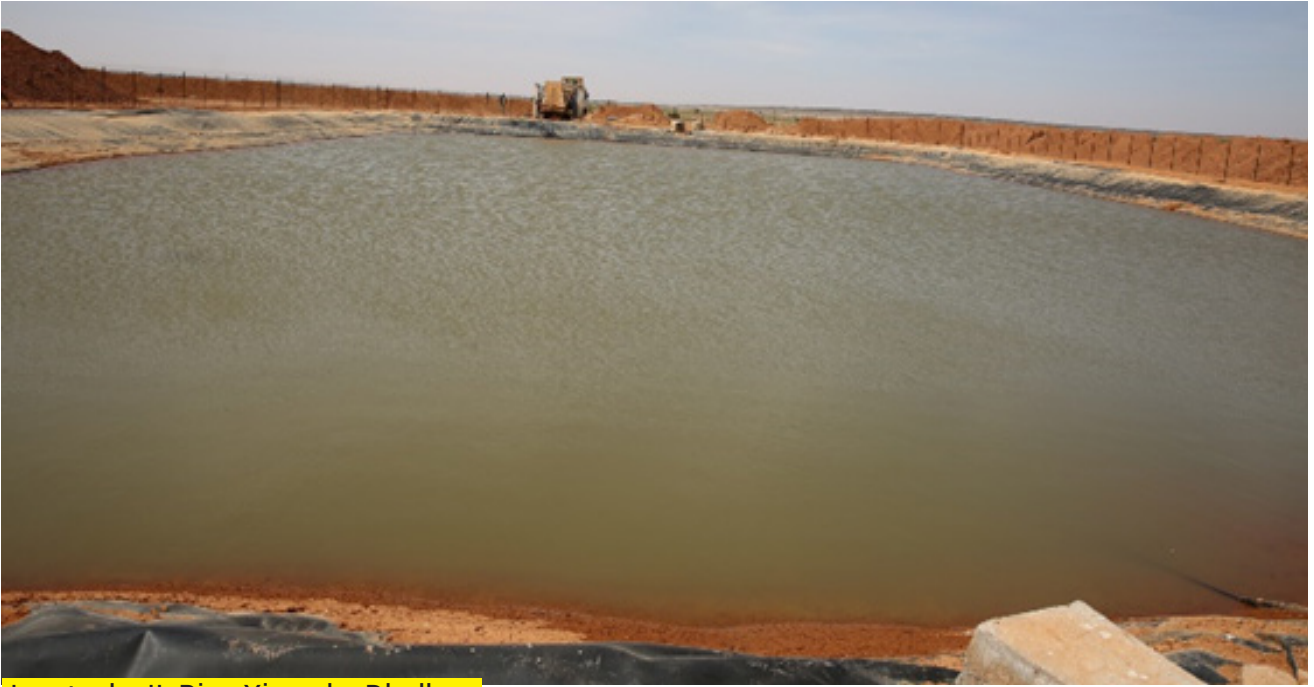
Jaantuska II: Biyo Xireenka Dhulka