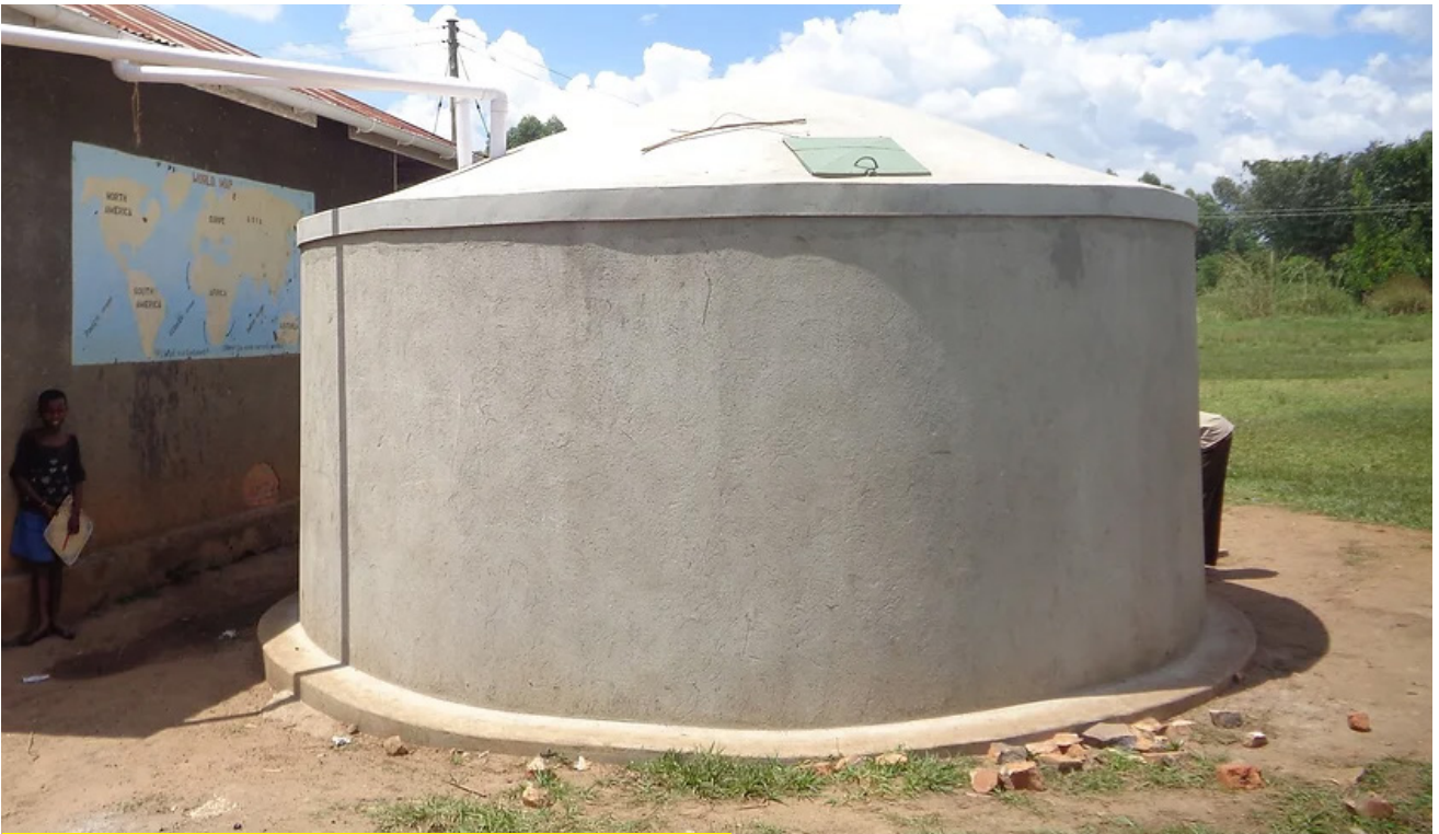
Jaantuska III: Haanta Kaydka Biyaha ee Roobka